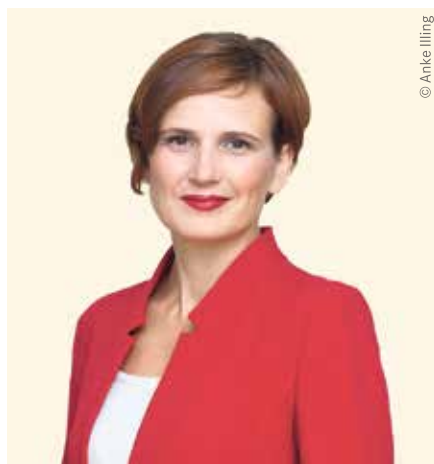
Katja Kipping, Senatorin für Integration, Arbeit und Soziales in Berlin

Katja Kipping , Senatorin für Integration, Arbeit und Soziales in Berlin, zeigt: Andere Bundesländer gehen Sachsen als Vorbild voraus